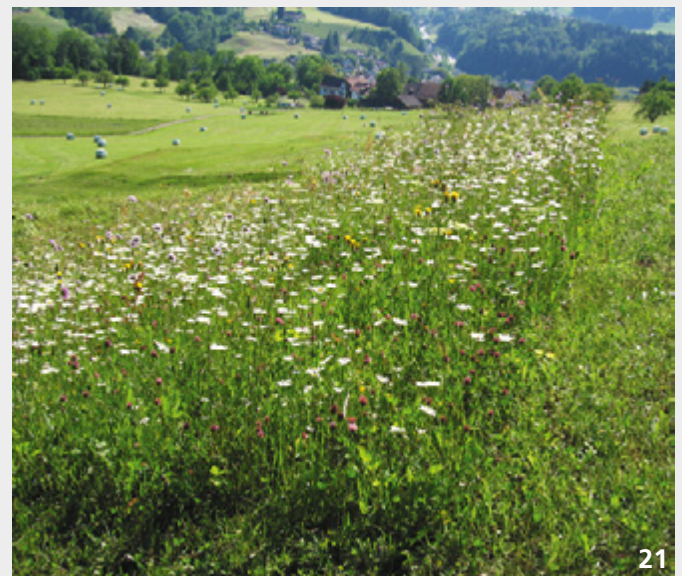
Das Stehenlassen von Rückzugstreifen ist nicht nur für viele Kleintiere ein Segen. Es ermöglicht auch das Absamen vieler Pflanzenarten.