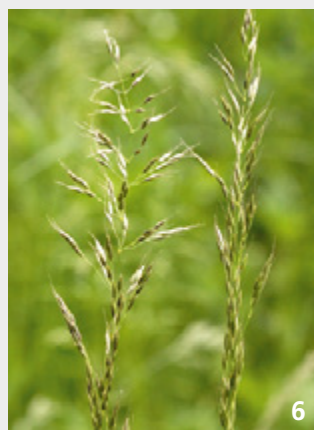
Oberhalb von rund 900 m ü. M. wird die Fromentalwiese durch die Goldhaferwiese abgelöst (Goldhafer Foto 6). Da Goldhaferwiesen im Gegensatz zu Fromentalwiesen nur beschränkt intensivierbar sind, sind sie noch deutlich häufiger und prägen in den Alpen bis heute weite Landstriche. Ihr Blumenreichtum ist legendär und gehört mit zu den wichtigsten touristischen Attraktionen des Berggebietes.