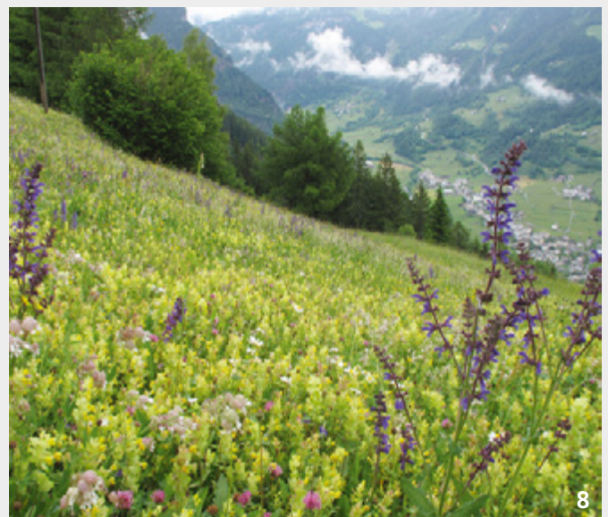
In Fromental- und Goldhaferwiesen neigt der Klappertopf dazu, überhand zu nehmen. Mit einer Frühlingsweide oder einem Frührschnitt kann die an Gräsern schmarotzende Pflanze wirksam und einfach zurückgedrängt werden.