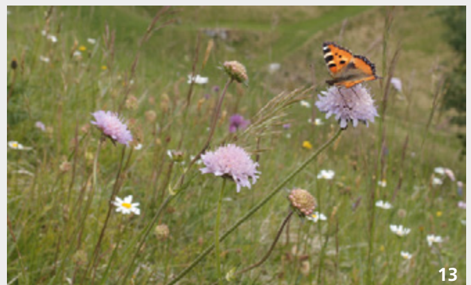
Die Blütenvielfalt von Fromental- und Goldhaferwiesen ist ein Magnet für das menschliche Auge wie für viele blütenbesuchende Insekten (z. B. Kleiner Fuchs).