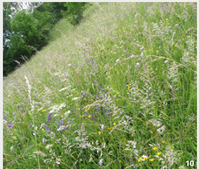
Artenreiche und futterbaulich wertvolle Fromentalwiese an einem leicht gemieteten, eher tiefgründigen Wiesenhang.