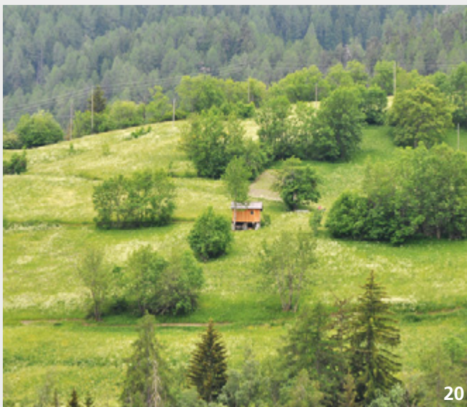
Strukturen sind für den faunistischen Wert von Fromental- und Goldhaferwiesen ausschlaggebend. Dazu gehören z. B. Rückzugsstreifen, Einzelbäume, Gebüsche und Gräben.