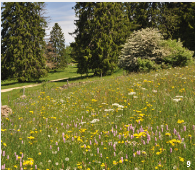
Typische, arten- und blumenreiche Goldhaferwiese im Jura.

Diese Werte sind ohne den Einsatz von Kraftfutter gerechnet. Sowohl der Kraftfuttereinsatz sowie die niedrige Milchleistungen oder Mutterkuhhaltung erhöhen den nötigen bzw. physiologisch sinnvollen Anteil an rohfaserreichem Grundfutter in der Gesamtration gegenüber den angegebenen Werten.