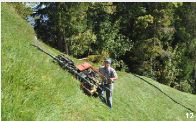
Fromental- und Goldhaferwiesen liefern im ersten Aufwuchs eher rohfasseriches, im Emdschnitt (Bild) eher eiweiss- und energiereiches Futter.

Fromentalwiesen und später geschnittene Goldhafer- sowie Magerwiesen liefern, im Gegensatz zu Fettwiesen, beim Heuschnitt hochwertiges, u.a. für die Aufzucht- und Galtphase von Milchkühen ideales Futter. Um den diesbezüglichen Bedarf zu decken, braucht ein Landwirtschaftsbetrieb in den tieferen Lagen auf mindestens 10 bis 25 % seiner Futterbaufläche Fromentalwiesen und auf weiteren 10 bis 25 % Magerwiesen. Bei Mutterkühen und in den höheren Lagen ist der angemessene Anteil höher. Daraus resultiert eine auf die jeweiligen Standortverhältnisse zugeschnittene Staffelung der Nutzungsniveaus, wie sie im Konzept des differenzierten Futterbaus angestrebt wird 6 .