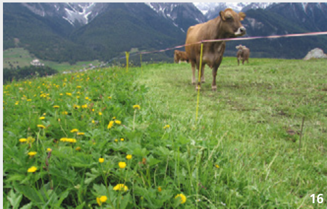
Mit einer Frühbeweidung können krautreiche Bestände wieder ins Gleichgewicht gebracht und Gräser gefördert werden.

pro Wiese individuell gewählt werden können. Dies erhöht die Flexibilität und Attraktivität und führt zudem zu einer angestrebten Verbesserung des Nutzungsmosaiks.