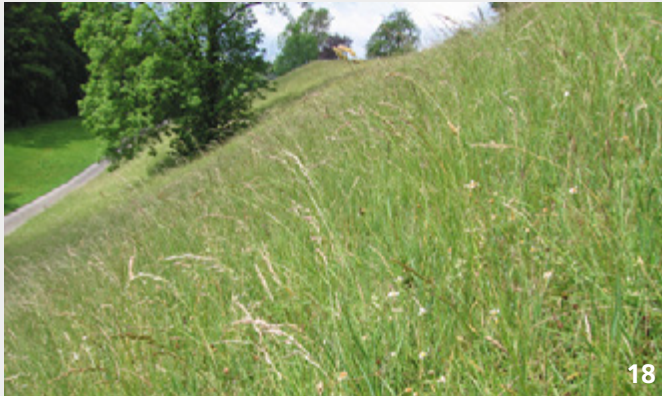
„Ausgehungerte“ Fromentalwiese: Die Aufrechte Tresse hat das Fromental und die Fülle an typischen Fromental-Wiesenblumen zurückgedrängt.

Fromental- und Goldhaferwiesen können unter bestimmten Bedingungen botanisch verarmen, wenn sie nicht regelmässig analog zur traditionellen Nutzung geringe Mistgaben erhalten. Sind Fromental- und Goldhaferwiesen als wenig intensiv genutzte Wiesen angemeldet, kann umgekehrt ein Zuviel an Nährstoffen ebenso negative Auswirkungen haben. Deshalb können individuelle Lösungen angezeigt sein.