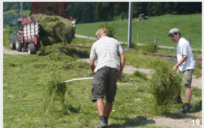
Neuanlage einer Fromentalwiese mittels Heugrassaat. Heugrassaat stellt quasi ein Kopierverfahren dar und ermöglicht die Erhaltung der lokalen Vielfalt an Pflanzen-Ökotypen.