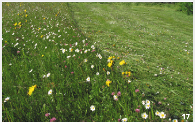
Während der Vollblüte sollten Fromentalwiesen nicht gemäht werden.