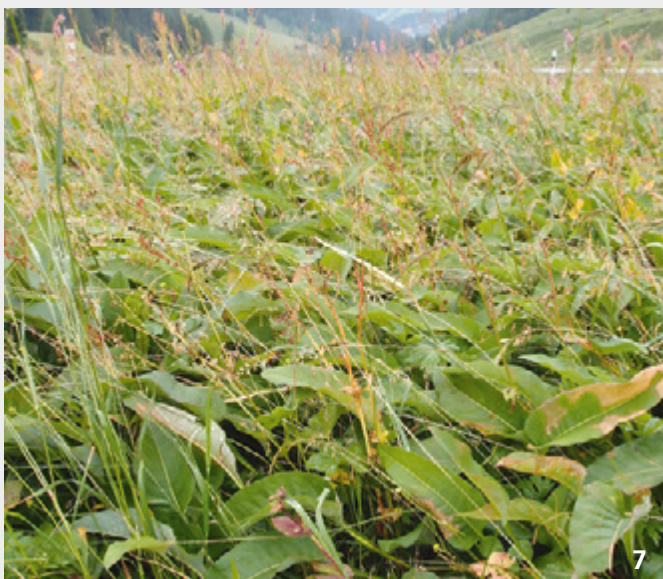
Eine durch Überdüngung mit Gülle degenerierte, verkrautete und futterbaulich wertlos gewordene Goldhaferwiese. In dieser Wiese hat der Schlangenknöterich fast alle anderen Arten verdrängt.

Verwendung wie einen dichotomen botanischen Bestimmungsschlüssel von oben nach unten; bei jeder Nummer wird entschieden, ob die Eigenschaften der ersten Linie (z. B. 0) oder jene der zweiten Linie (z. B. 0*) zutreffen; Kolonne rechts gibt den Wiesentyp oder die Nummer, bei welcher weitergefahren werden muss. M-% = Massenanteil im ersten Aufwuchs in Prozent.