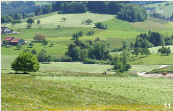
Wiesenlandschaft im Zürcher Oberland: Zu wissen, wo sich in diesem Mosaik noch letzte Reste wertvoller Fromental- und Goldhaferwiesen finden, ist für deren gezielte Erhaltung und Förderung unumgänglich.

Nur was bekannt ist, kann auch gezielt erhalten werden. Im Gegensatz zu den meisten anderen stark gefährdeten Lebensräumen existiert für die Fromental- und Goldhaferwiesen bisher kein Inventar. Für Vernetzungsprojekte ist eine Kartierung ein unumgängliches Instrument, um den Ist-Zustand beurteilen und Ziele bzw. Massnahmen festlegen zu können.